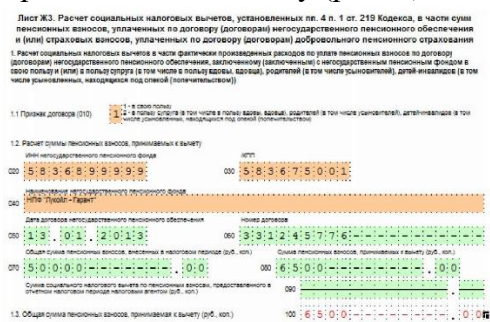
Рис. 4. Лист ЖЗ

негосударственного пенсионного обеспечения и (или) страховых взносов, уплаченных по договору (договорам) добровольного пенсионного страхования. Известно, что Анастасия Андреевна перечисляла денежные средства НПФ «Лукойл-Гарант», в размере 50 000 руб. за 2019 г. По строке 010 (Признак договора) необходимо указать «1», так как Солнцева уплачивала денежные средства за себя. По строкам 020-060 заполняются сведения о негосударственном пенсионном фонде. В строку 070 (общая сумма пенсионных взносов, внесенных в налоговый период) указываем 50 000 руб. Сумма пенсионных взносов, принимаемая к вычету (строка 080), составляет 13 % от суммы пенсионных взносов, внесенных в данный период. Она составит 50 000 руб. x 13 % = 6500 руб. При произведении расчета эта сумма отражена по строке 100 - общая сумма пенсионных взносов, принимаемая к вычету (рис. 4).