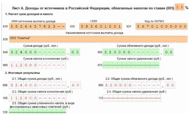
Рис. 5. Лист А (2)

При получении дохода в виде выигрыша (автомобиль DaewooMatiz) Солнцева обязана заполнить лист А (2). Доходы от источников в Российской Федерации, облагаемые налогом по ставке 35 % (ее необходимо выбрать самостоятельно, руководствуясь п. 2 ст. 224 НК РФ). По строкам 010-030 заполняется информация об источнике выплаты дохода (ООО «Счастье»). По строке 040 отразим сумму выигрыша, равную 324 000 руб. Сумма облагаемого дохода, которую заносим в строку 050 равна 320 000 руб. (так как в соответствии с п. 28 ст. 217 НК РФ стоимость подарков до 4000 руб. налогом не облагается). При расчете по строке 060 отражена сумма исчисленного налога, равная 112 000 руб. (рис. 5).