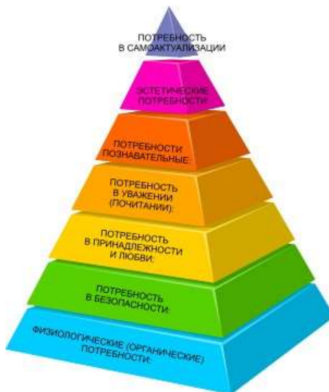
Рисунок 1 – Пирамида Маслоу

Объяснить, почему одни расходы приоритетнее других. Обсудить на примере пирамиды потребностей Маслоу.