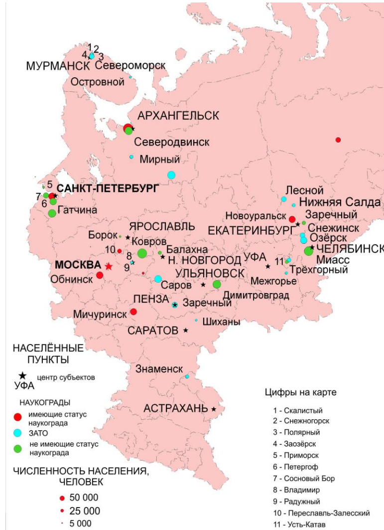
Рис. 1.2. Наукограды европейской части России (составлено автором)