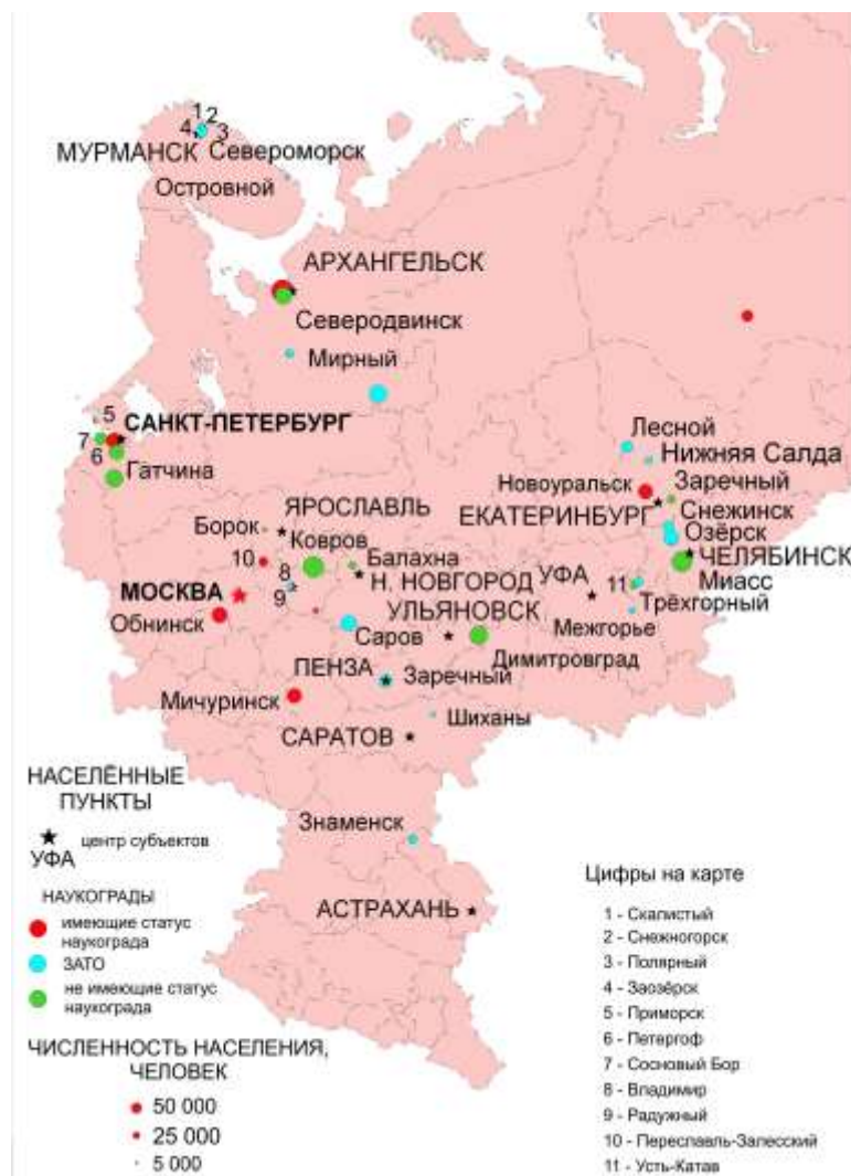
Рис. 1.2. Наукограды европейской части России (составлено автором)