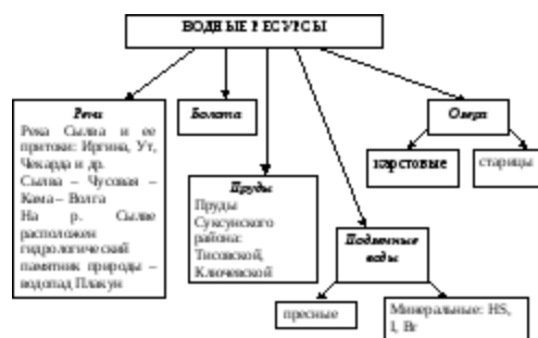
Рис. 3.7. Водные ресурсы Суксунского муниципального района Пермского края (составлено автором)