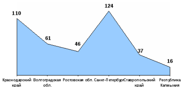
Рисунок 1 – Сведения о количестве учреждений социального обслуживания семьи и детей