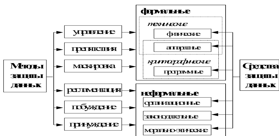
Рис. 1 Классификация методов и средств защиты данных.

Рассмотрим кратко основные методы защиты данных. Классификация методов и средств защиты данных представлена на рис. 1.