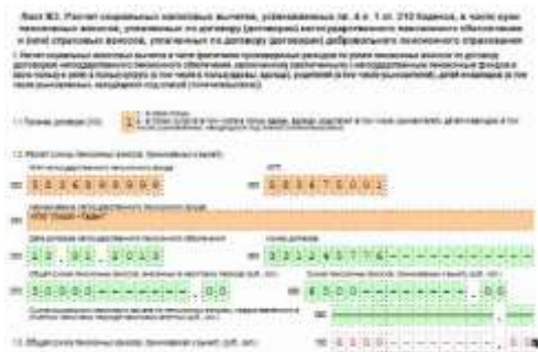
Рис. 4. Лист ЖЗ

Переходим к заполнению Листа ЖЗ - Расчет социальных налоговых вычетов, установленных пп. 4 п. 1 ст. 219 Кодекса, в части сумм пенсионных взносов по договору (договорам) негосударственного пенсионного обеспечения и (или) страховых взносов, уплаченных по договору (договорам) добровольного пенсионного страхования. Известно, что Анастасия Андреевна перечисляла денежные средства НПФ «Лукойл-Гарант», в размере 50 000 руб. за 2019 г. По строке 010 (Признак договора) необходимо указать «1», так как Солнцева уплачивала денежные средства за себя. По строкам 020-060 заполняются сведения о негосударственном пенсионном фонде. В строку 070 (общая сумма пенсионных взносов, внесенных в налоговый период) указываем 50 000 руб. Сумма пенсионных взносов, принимаемая к вычету (строка 080), составляет 13 % от суммы пенсионных взносов, внесенных в данный период. Она составит 50 000 руб. x 13 % = 6500 руб. При произведении расчета эта сумма отражена по строке 100 - общая сумма пенсионных взносов, принимаемая к вычету (рис. 4).